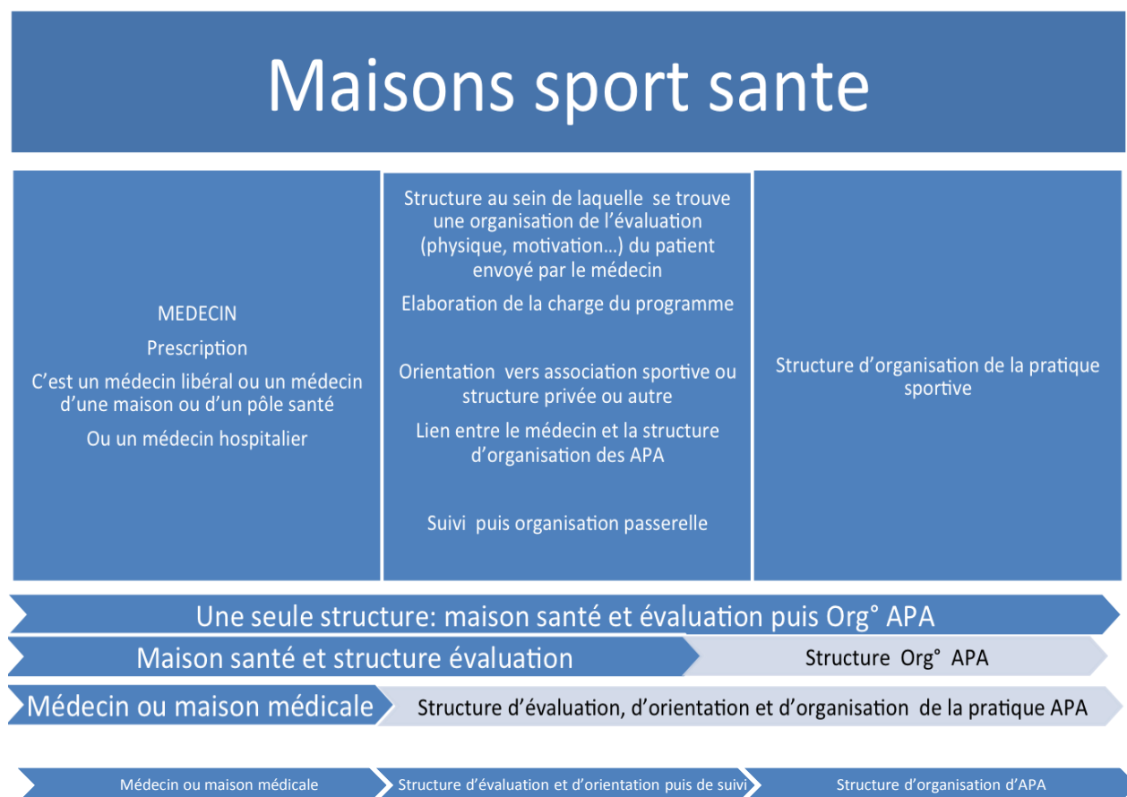
Tableau 21 : Schéma d'organisation d'une maison « sport santé »

[265] La présentation schématique ci-dessus permet de montrer différentes formes d'organisation susceptibles d'être mises en place et pouvant prendre appui sur des structurations existantes. Le respect du cahier des charges des services rendus doit en effet l'emporter sur une organisation standardisée au niveau national.