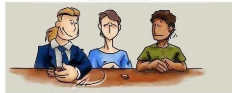
il se retourne ensuite vers l'ouvrière et crie "attention, le migrant va te prendre ton biscuit"