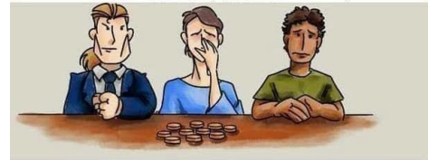
le patron en prend neuf pour les redistribuer à ses actionnaires